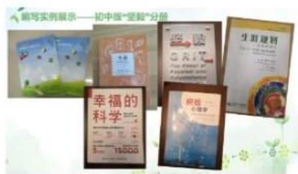
【学习资料包2】（“分享我的‘坚持’”活动环节使用）